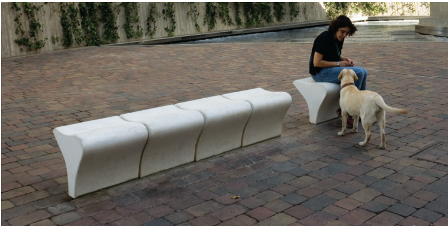
Proyecto Tirso Molina, Madrid (España)

SU SIMPLICIDAD Y DISCRECIÓN HACEN QUE SE INTEGRE FÁCILMENTE EN MÚLTIPLES ESCENARIOS