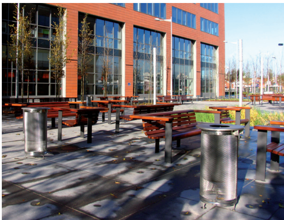
Parc du Millénaire, París (Francia)