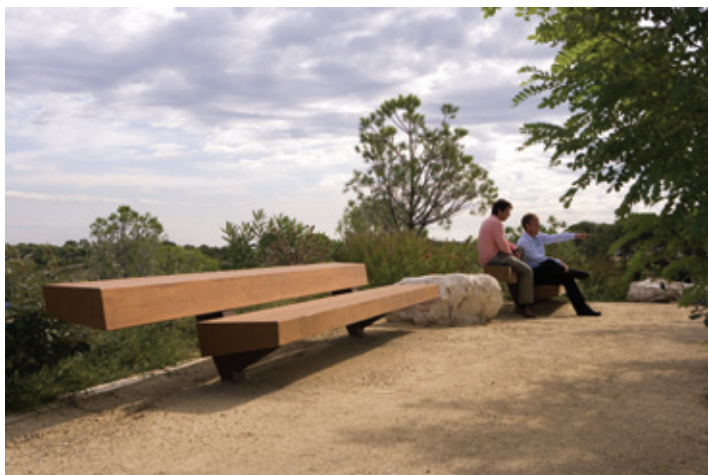
Port Aventura, Salou (España)