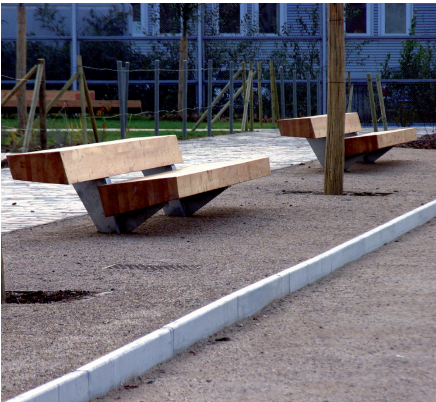
Parque Clichy Batignoles, Paris (Francia)