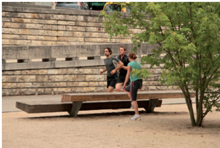
Lyon ( Francia )