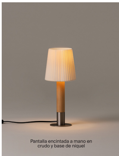
Pantalla encintada a mano en crudo y base de níquel