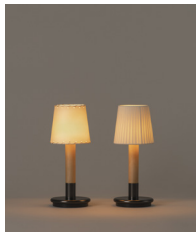
Básica Mínima Batería