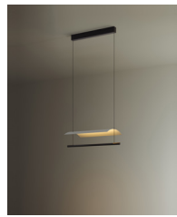
Lámina 45 / 85